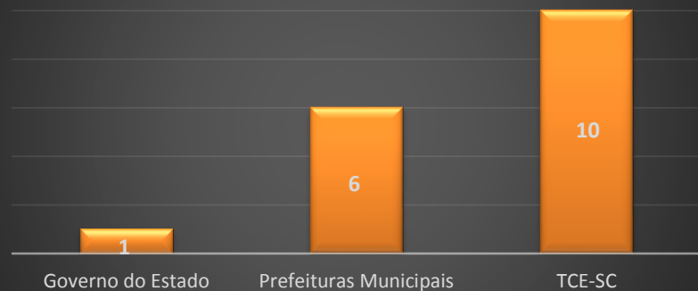
Demandas por Órgão de Referência