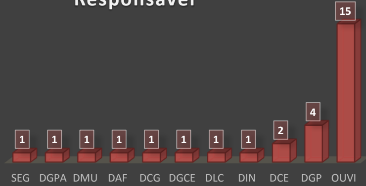
Demandas por Unidade Responsável