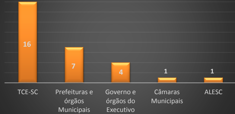
Demandas por Órgão de Referência