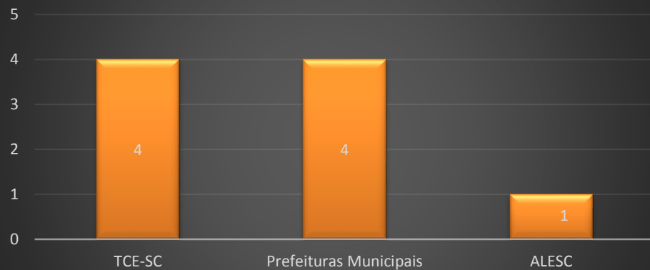
Demandas por Órgão de Referência